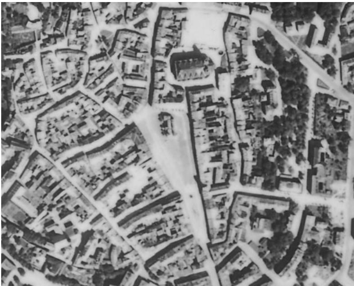
Ortofoto mapa středu města z roku 1948 4