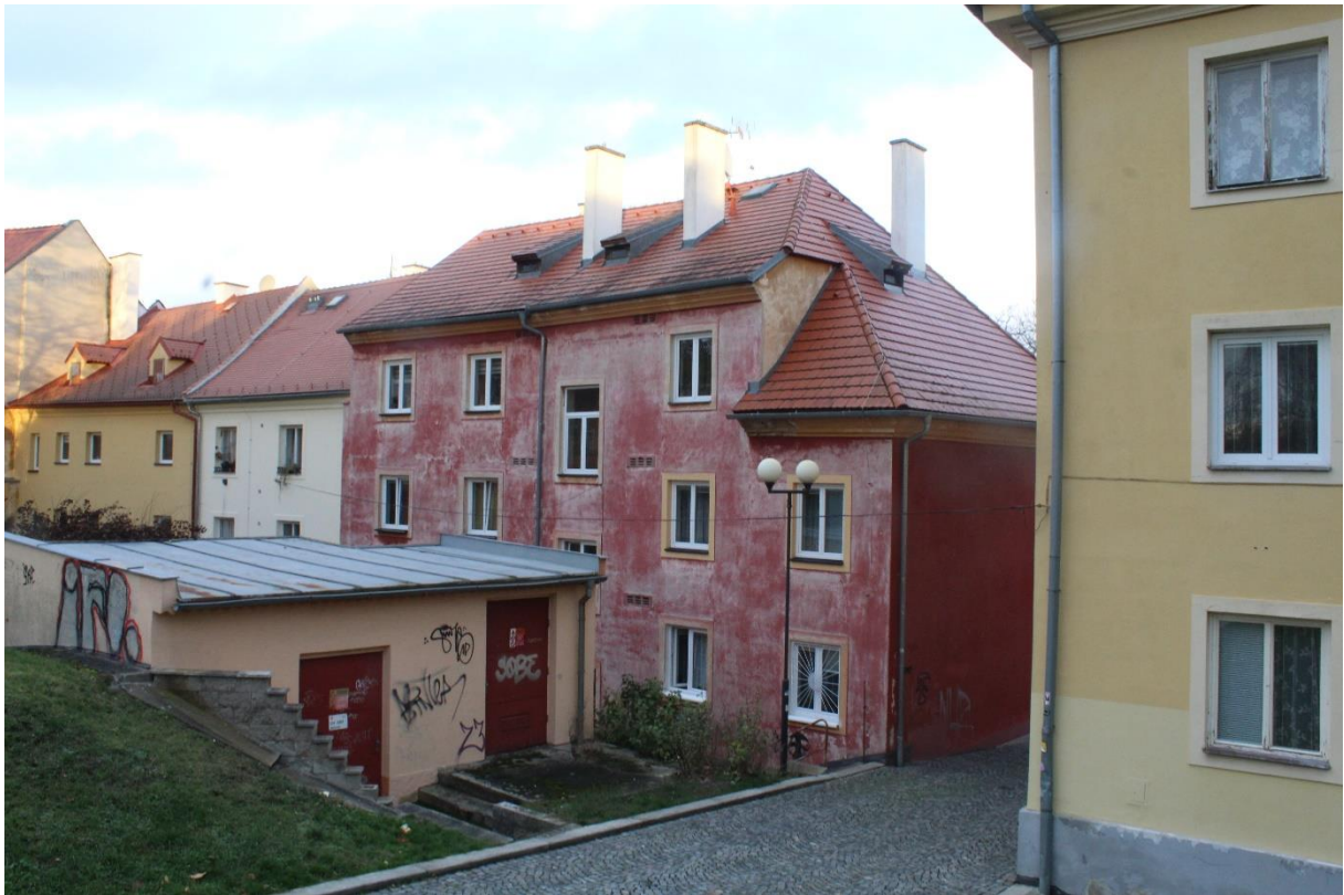
Jánské náměstí 269