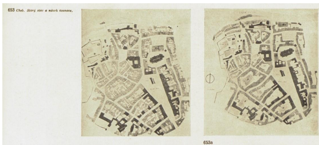
Návrh asanace, 1950 11