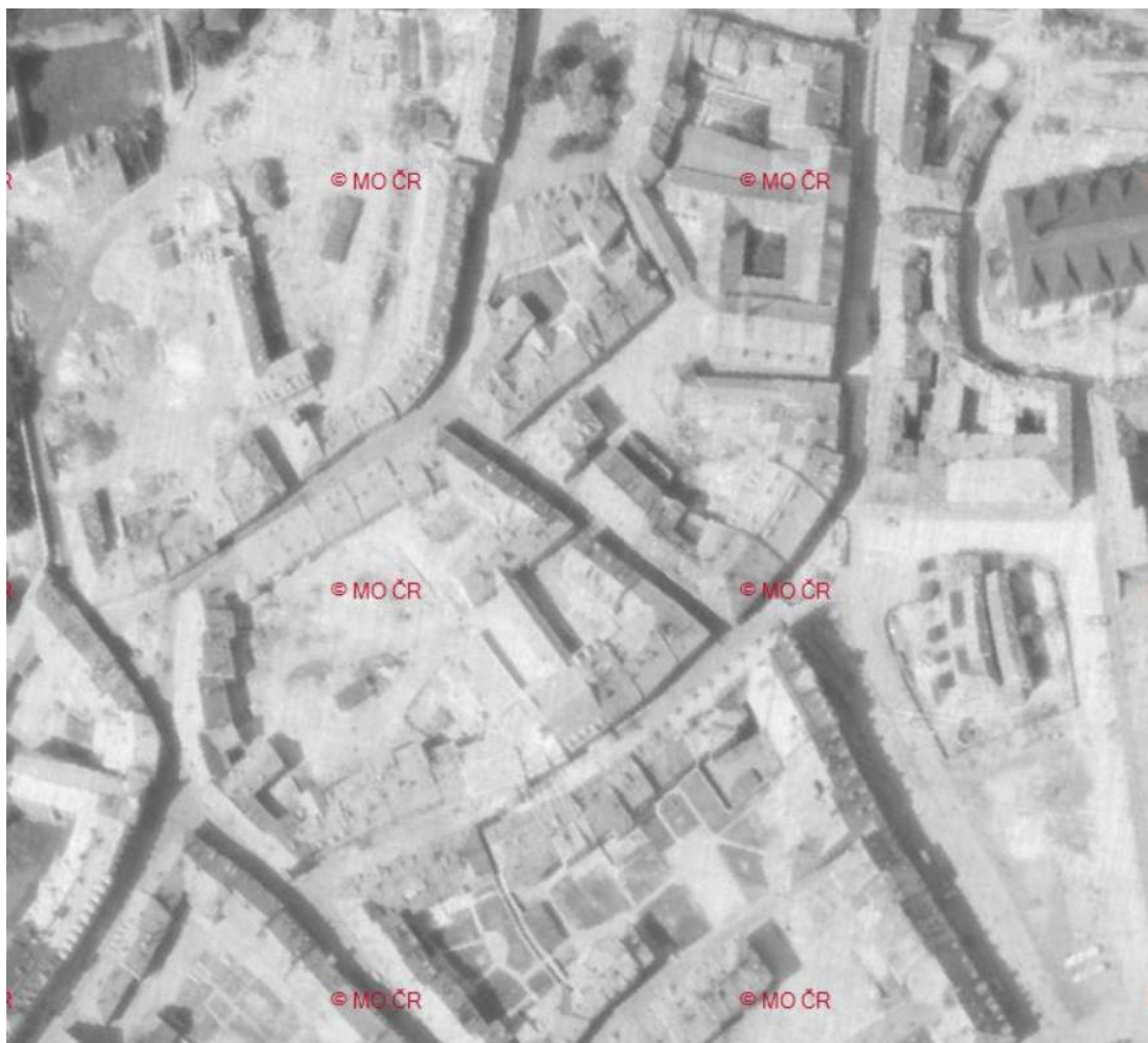
Měsíční krajina. Rok 1964 4