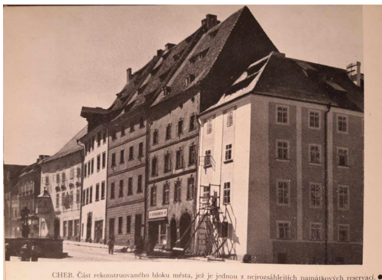
Pohled na probíhající rekonstrukce na náměstí z roku 1958 7