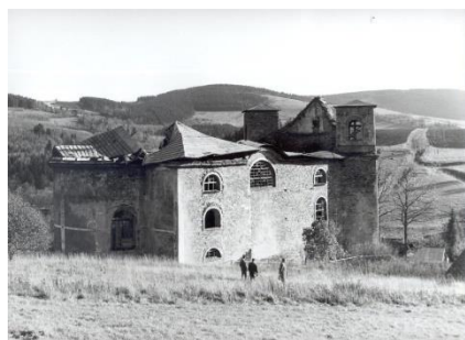
Obrázek 7: Chátrající kostel 20