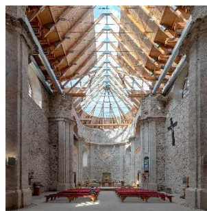
Obrázek 10: Nový interiér 20