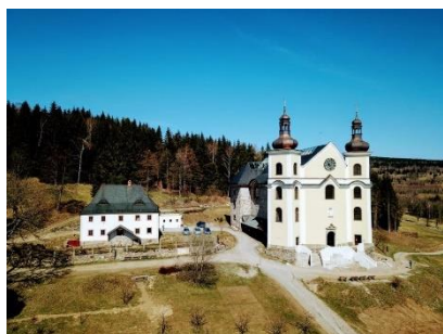
Obrázek 9: Zrekonstruovaný kostel 20

Před spuštěním rekonstrukčních prací bylo nejprve nutné odklidit trosky a suť z vnitřního prostoru kostela, o to se postarali převážně dobrovolníci. Od roku 2003 pak mohly začít opravy, postupně se přistoupilo k sanaci zdiva, omítnutí průčelí a položení nové podlahy 23 , záměrem rekonstrukce ovšem nebyl návrat kostela do původní podoby. Zvláště interiér někdejšího barokního klenotu byl natolik poškozený, že prakticky nebylo k čemu se vracet. Zachovány byly původní zdi a obnoveno jižní průčelí, ale interiér zůstal holý, a hlavně dostal kostel neobvyklou skleněnou střechu, zhotovenou podle návrhu Ing. arch. P. Dostála a Ing. J. Starého 24 v roce 2007 25 . Použití skla zde není samoučelné, má význam zásadní, odkazuje jak k bohoslužbám konaným pod širým nebem v 90. letech, tak k tradici sklářství celé oblasti.