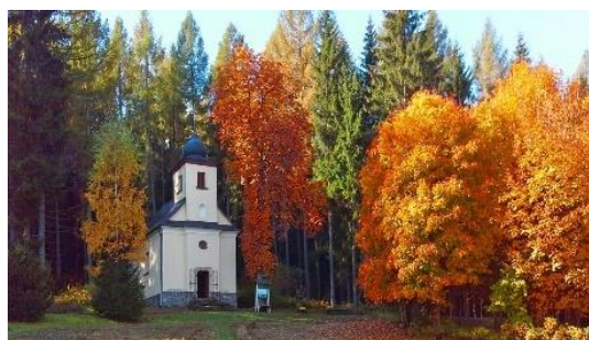
Obrázek 6: Kaple Černé Vodě 14