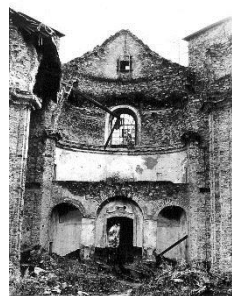
Obrázek 8: Interiér kostela 20