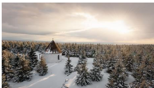
Obrázek 5: Kunštátská kaple 13

Za svůj dlouhý život v horských podmínkách bylo drobné svatostánky třeba průběžně opravovat, pokud byla původní kaplička dřevěná, nahradila ji později kamenná, když blesk zapálil střechu, nahradila ji modernější – vždy když bylo třeba, našel se dobrodinec, který opravy provedl, nebo alespoň zafinancoval, kapličky se postupně měnily, ale zachovávaly si přitom svou duši, vtiskly se do tváře Orlického pohoří a splynuly s ním. 12