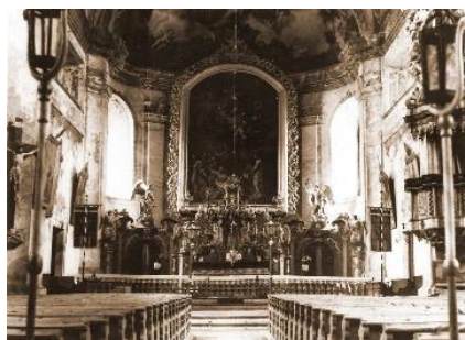
Obrázek 4: Původní interiér kostela 11