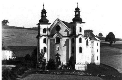
Obrázek 3: Původní kostel 10

V době jeho největší slávy kostel navštěvovaly i tisíce poutníků ročně a údajně se v něm uskutečnilo každý rok až 400 zázraků 9 , často se jednalo o zázračné uzdravení pomocí pramene, který tryskal poblíž kostela.