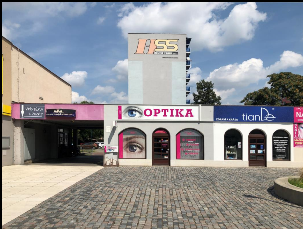
Občanská vybavenost sídliště Slovácká, Břeclav.