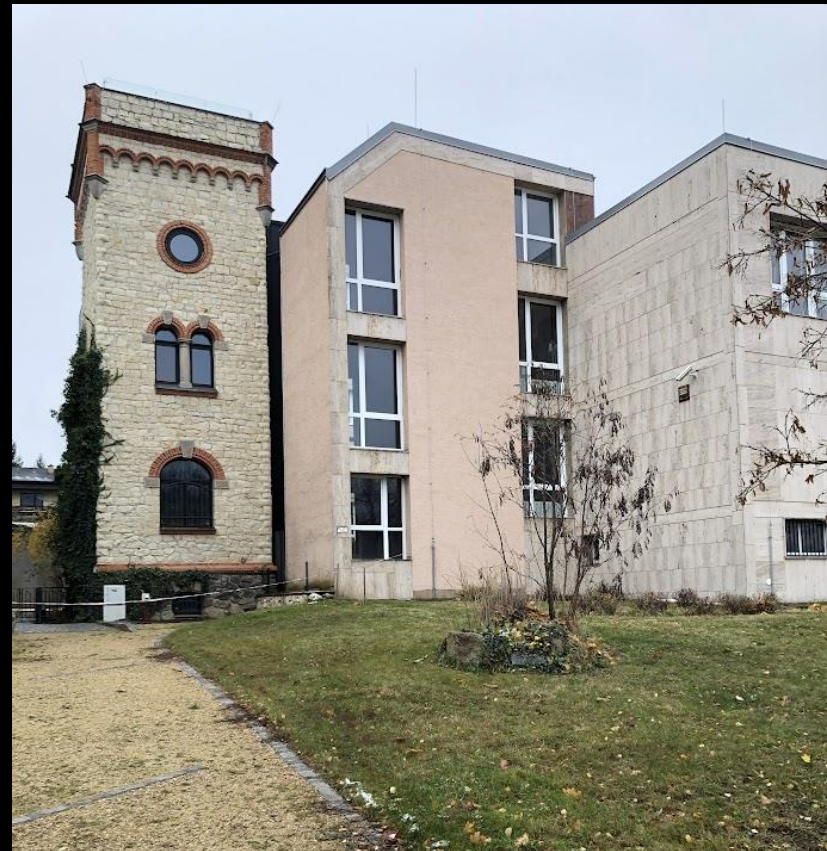
Bývalé ústředí KSČ Blansko, dnes okresní soud.

Výsledky poslouží k výukové inovaci (interpretace dějin architektury; aplikace teoretických metod do praxe) předmětů Dějiny a teorie architektury VI (513DAT6), Kulturologie (513KUL) a ateliérových konzultací .