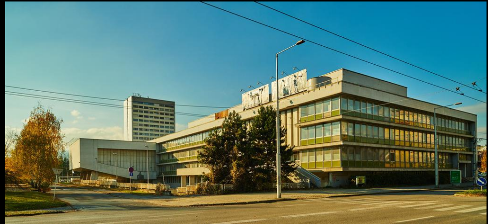
Dům kultury Banská Bystrica.

Fotodokumentace a projektová dokumentace