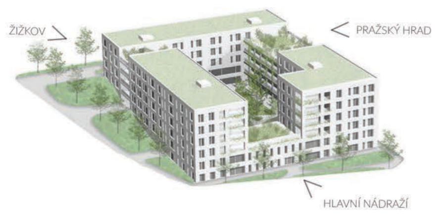
KONCEPT - BLOK SE ZELENÍ A STŘEŠNÍMI TERASAMI