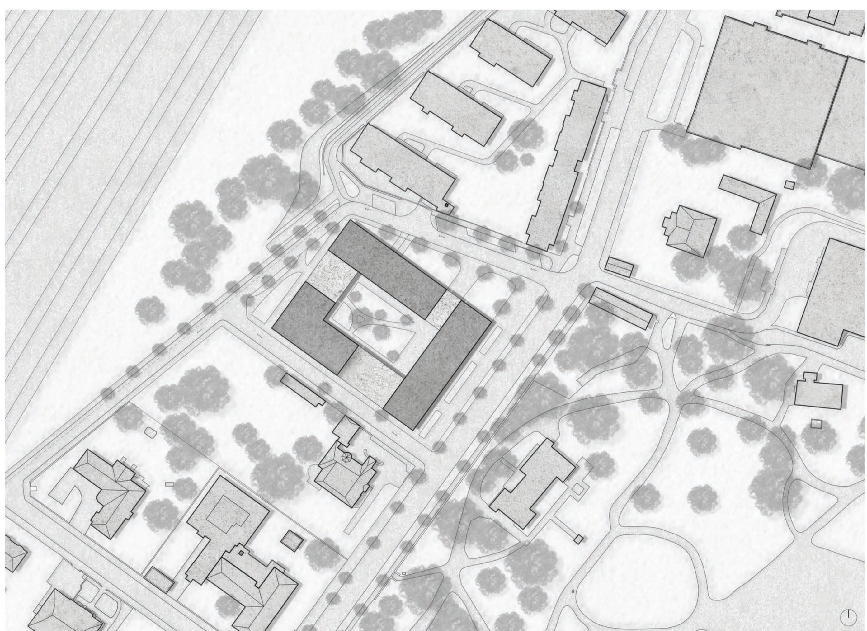
SITUACE 1 : 1 000

Bc. Barbora Langmajerová ATELIÉR ŠESTÁKOVÁ - DVOŘÁK