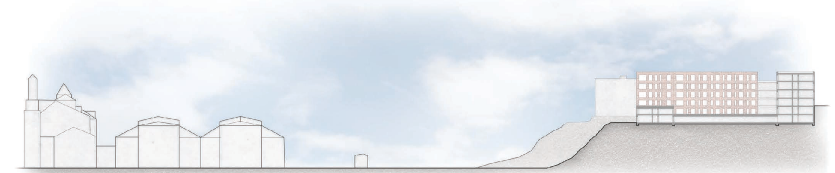
SCHEMATICKÝ ŘEZ ÚZEMÍM

Architektonický výraz objektu by měl navozovat klidný dojem, pocit stability či bezpečí. Obkladové režné zdivo strukturuje plochy zdi a navazuje na tento typ fasád na vilových domech. Francouzská okna umožňují seniorům co největší výhled a zároveň systém otevírání oken skrz perforovanou fasádu zaručuje bezpečí.