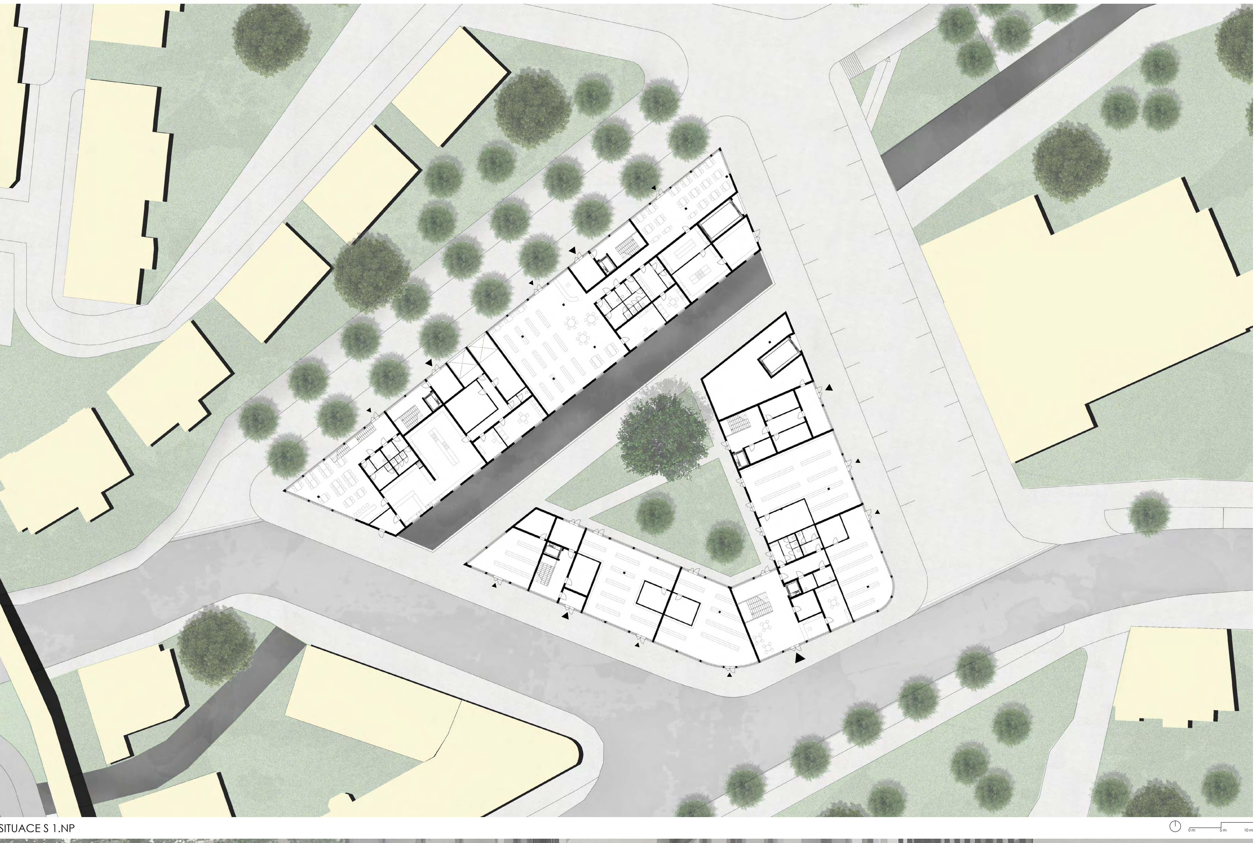
SITUACE 1 NP