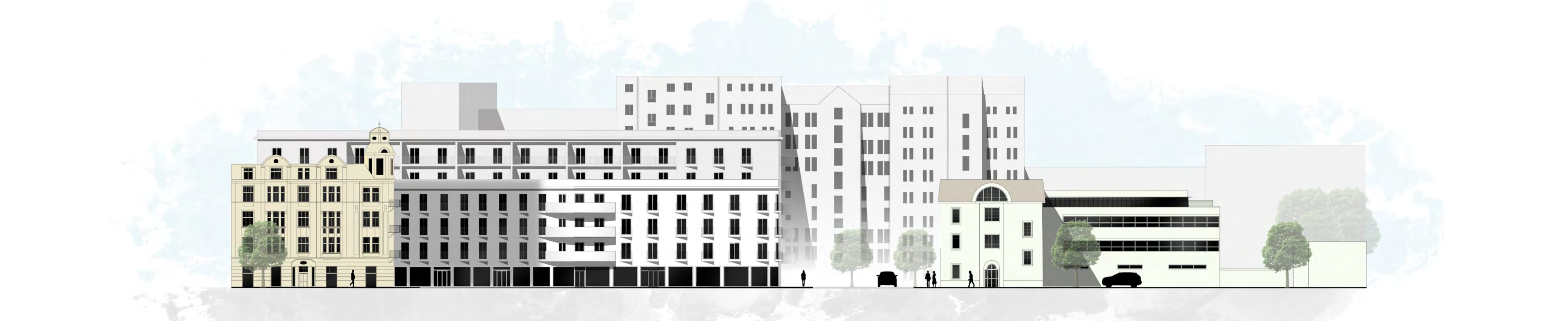
POHLED JIŽNÍ Z ULICE S. KVĚTNA