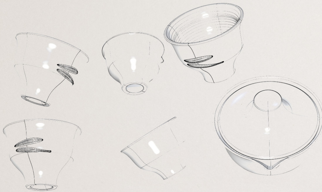
Ukázka návrhových skic